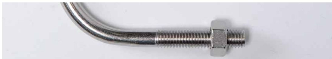
TABLEAU DES POIDS